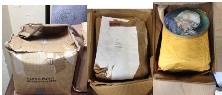
Imagen 1: Estado de la llegada al Departamento de Conservación y Restauración de la BNCJM de los documentos del archivo personal de Jaime Sarusky Miller, para iniciar el trabajo de preservación

La comparación de una biblioteca con una caja de regalo, es un símil descifrable, porque nunca sabemos lo que encontraremos dentro. En este estudio fue realidad ya que los materiales del archivo personal de Jaime Sarusky llegaron en cajas de cartón y la documentación dentro de cualquier tipo de sobre, files o carpeta no idóneo para su conservación. Como se aprecia en las imágenes siguientes: