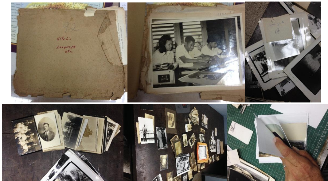
Imagen 3: trabajo realizado con las 633 imágenes fotográficas relacionadas con la comunidad sueca en Cuba y que luego de ser clasificadas y limpiadas ocuparon 31 sobres con calidad de archivo para su conservación y servicios a los investigadores

Mientras se realizaba el diagnóstico de la evaluación del deterioro presente en el archivo personal de Sarusky, se efectuaba el trabajo de conservación preventiva es decir se hacía la limpieza mecánica a cada uno de los materiales, manteniendo todo el tiempo el orden dado al fondo de documentos por el intelectual cubano. Encontramos 633 fotos agrupadas en dos sobres sin calidad de archivo, por lo que en este punto el trabajo se complejizó (imagen 3). Importante señalar que en varios de los sobres o files numerados por el propio escritor encontramos imágenes fotográficas y lo realizado con las mismas fue: después de la limpieza mecánica las fotos se colocaron en sobres libres de ácido y este a su vez dentro del sobre que contiene el resto de los documentos. Por lo que con las 633 imágenes que pertenecían todas a indagación realizada por el autor sobre la comunidad sueca en Cuba, lo que se realizó fue: agruparlas por materias, respetando los tópicos dados por Jaime Sarusky en la investigación a esta temática, el apoyo para la comprensión de la imágenes en cuanto a su tema se obtuvo de los papeles que estaban en uno de los sobre, usándolo como guía y leyendo la papelería para agrupar las imágenes por familias o representación de sus labores de vida. Al final se dividieron en un total de 31 sobres correspondiendo al mismo número de materia de las imágenes fotográficas.