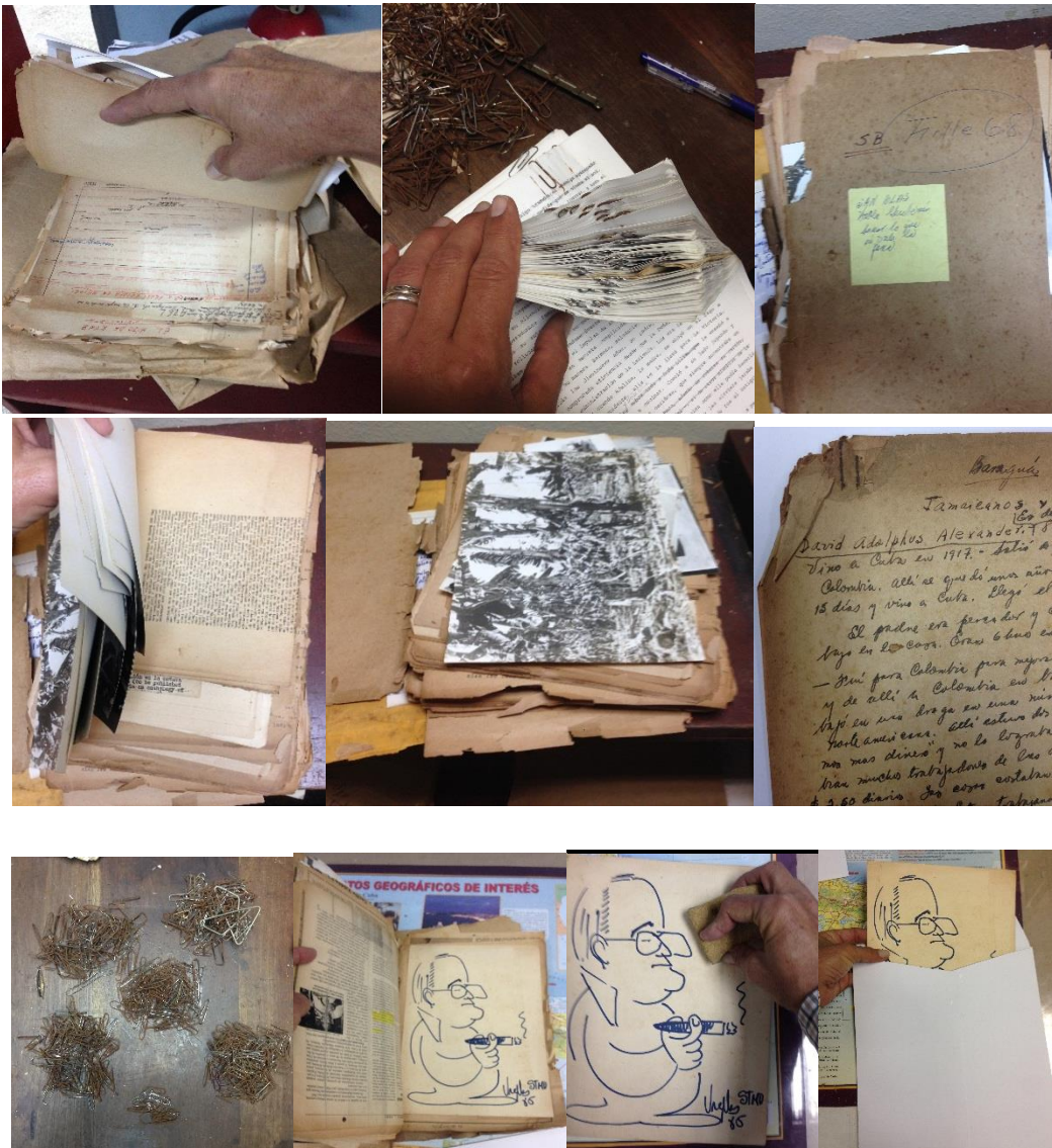
Imagen 2: factores de deterioro intrínseco y extrínseco

El total de hojas de papel que conforman los documentos de esta colección proviene de procesos mecánicos en su fabricación, por lo que las fibras son pequeñas y débiles. La pulpa contiene un gran porcentaje de lignina, convirtiendo las hojas en poco permanente, por lo que la papelería de forma general esta amarillo y quebradizo. Todo esto aumentado por el entorno en el que han permanecido los documentos del archivo personal de intelectual, activando los procesos de oxidación y acidificación de muchos de los soportes. Otros de los deterioros presente en los materiales estaban dado por: unión de diferentes tipos de papel y diferentes materiales dentro del propio envoltorio donde se atesoraban; se encontraron daños físicos por incorrecta manipulación; oxidación y taladraduras por más de 685 presillas metálicas, las cuales fueron retiradas de los documentos; sobres y carpetas que los contenían no adecuados para la conservación. Como se puede apreciar en las imágenes siguientes: