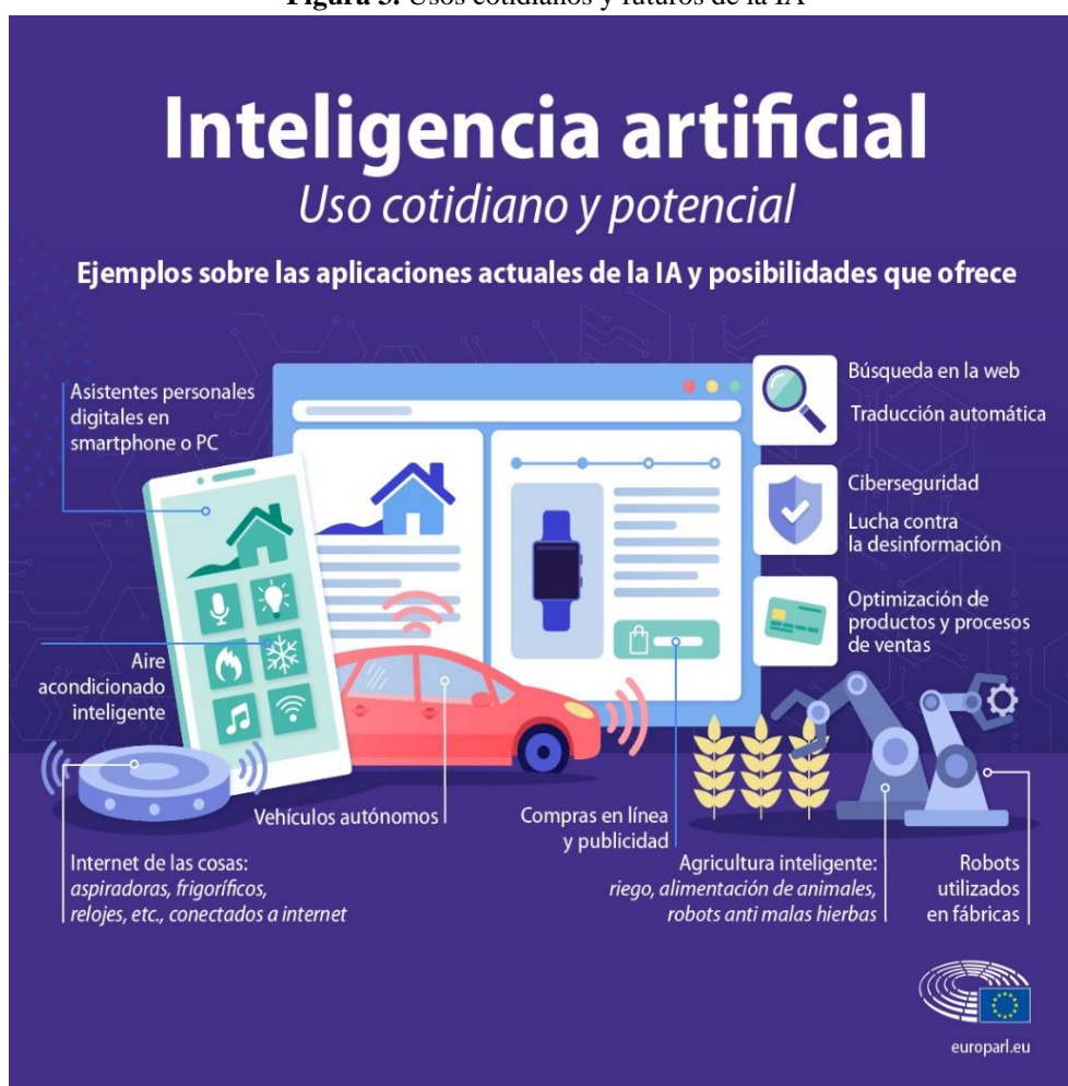
Figura 3. Usos cotidianos y futuros de la IA

Sobre el avance de la IA, Bryson (2018, p. 128) aclara: “Los avances de la IA a la hora de superar la capacidad humana en ciertas actividades llegan ahora a los titulares, pero la IA está presente en la industria desde, al menos, la década de 1980.” Lo que sí es innegable es una expansión en los últimos años, las aplicaciones de la IA se extienden a todas las áreas de la sociedad y hoy ya existen innumerables ejemplos de su uso (figura 3).