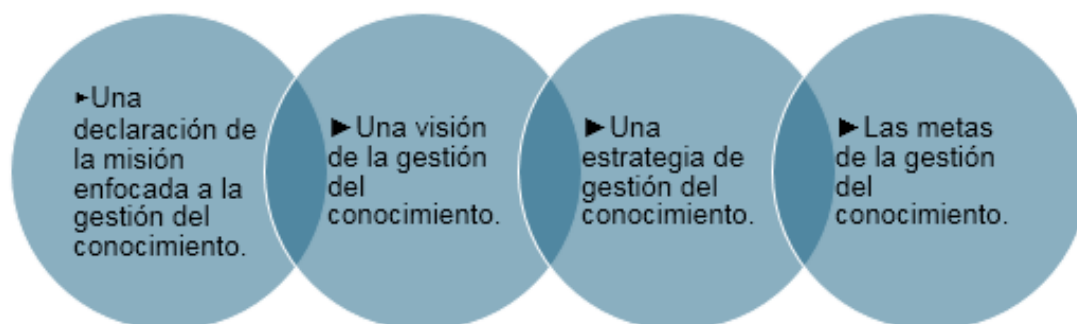
Figura 3: Guía de ejecución de tareas

La estrategia y los objetivos de la gestión del conocimiento actuarán como puntos de referencia para guiar las tareas del proyecto durante las próximas fases. ¿Cuáles beneficios obtiene la empresa que implementa la gestión del conocimiento? La gestión del conocimiento en una empresa tiene como objetivos generales identificar, adquirir, desarrollar, compartir, utilizar y retener el resultado de la unión de la información disponible y las opiniones, experiencias y puntos de vista que aportan todos los integrantes de la empresa, para utilizarlos en su beneficio. En base a las conclusiones de Pereira (2011) la gestión del conocimiento busca los siguientes beneficios específicos: